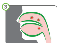
3 Reduziert Eindringen von Erkältungsviren