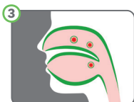
3 Reduziert Eindringen von Erkältungsviren